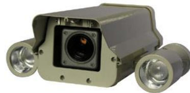
Installation Sample Housing sold separately