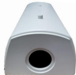
Opcional: Visor frontal Broadband Crystal IR para câmera térmica