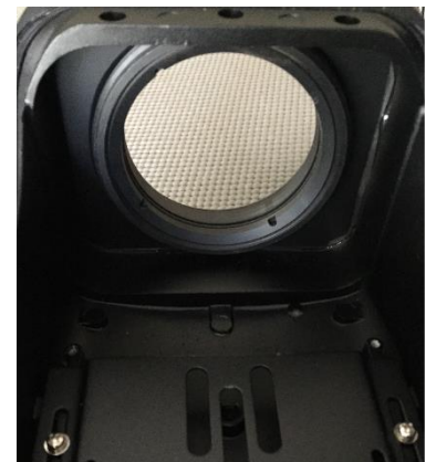
Opcional: Visor frontal Broadband Crystal IR para câmera térmica